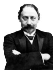
EDVARD BRANDES (1847-1931) STIFTER AF POLITIKEN I 1884