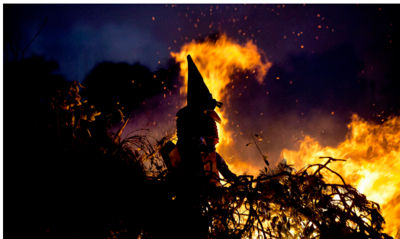
HEKSEJAGT. I aften brænder danskerne hekse af. Men hvad symboliserer hekse egentlig i vores tidsalder?

I gamle dage kunne man nu ellers godt bævne, hvis der var en heks i nabolaget. Det at være ramt af uheld, at blive alvorlig syg eller dødsfald kunne være tegn på