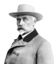
VIGGO HØRUP (1841-1902) STIFTER AF POLITIKEN I 1884

2 læserbreve og debatindlæg handlede om Tramadol